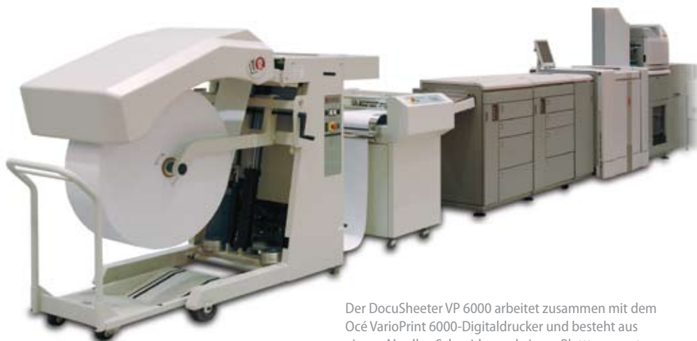
Der DocuSheeter VP 6000 arbeitet zusammen mit dem Océ VarioPrint 6000-Digitaldrucker und besteht aus einem Abroller, Schneider und einem Blatttransport.